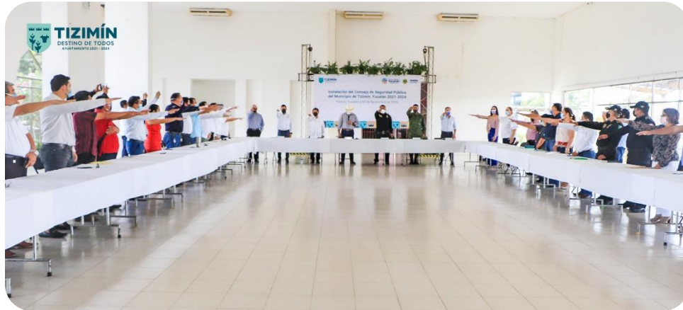
Toma de protesta de los Integrantes del Consejo Municipal de Protección Civil.

actividades que en materia de prevención y seguridad pública se lleven a cabo en el municipio, dando cumplimiento a lo dispuesto por la Constitución Política de los Estados Unidos Mexicanos, la Ley General del Sistema Nacional de Seguridad, la Constitución Política del Estado de Yucatán, la Ley del Sistema Estatal de Seguridad Pública, y la Ley de Gobierno de los Municipios del Estado de Yucatán.