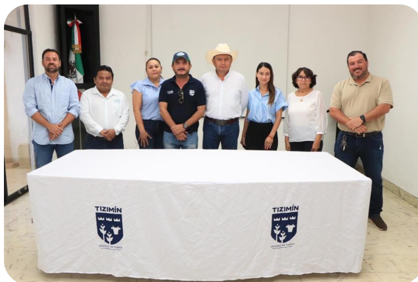
Regidores integrantes de la bancada del Partido Acción Nacional (PAN).

Continuando con las acciones de Prevención, la Unidad de Protección Civil del Ayuntamiento de Tizimín, para evaluar el cumplimiento de las medidas de Seguridad en los inmuebles, y la normatividad plasmada en las Leyes de Protección civil, realizó las verificaciones e inspecciones a diversos locales comerciales. También, realizó 56 asesorías para el trámite de Dictámenes Técnicos en el Municipio, y para 76 Programas Internos de Protección Civil. Estas acciones se realizan de manera constante, para poder dar seguridad en la materia a todos los habitantes de Tizimín y sus comisarias.