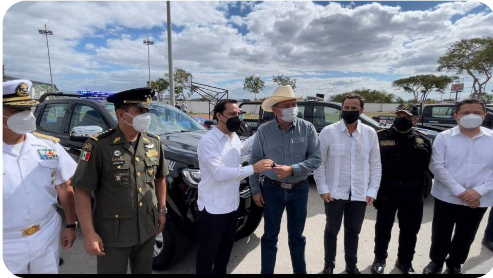
Entrega de 3 patrullas y 2 moto patrullas por parte del Gobernador del Estado de Yucatán el Lic. Mauricio Vila Dosal al Presidente Municipal C. Pedro Francisco Couoh Suaste y al Regidor Secretario Javier Portillo Vergara.