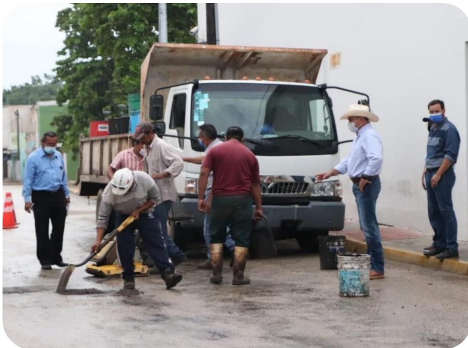
Inicio de los trabajos del Programa Permanente de Bacheo.

Con la finalidad de mantener en correcto estado las diferentes áreas verdes de la ciudad, se compró un tractor Mahindra para chapeo, mismo que es utilizado para fertilizar y fumigar plantas y jardines, con un costo aproximado de $300,000.00 (trescientos mil pesos M.N.).