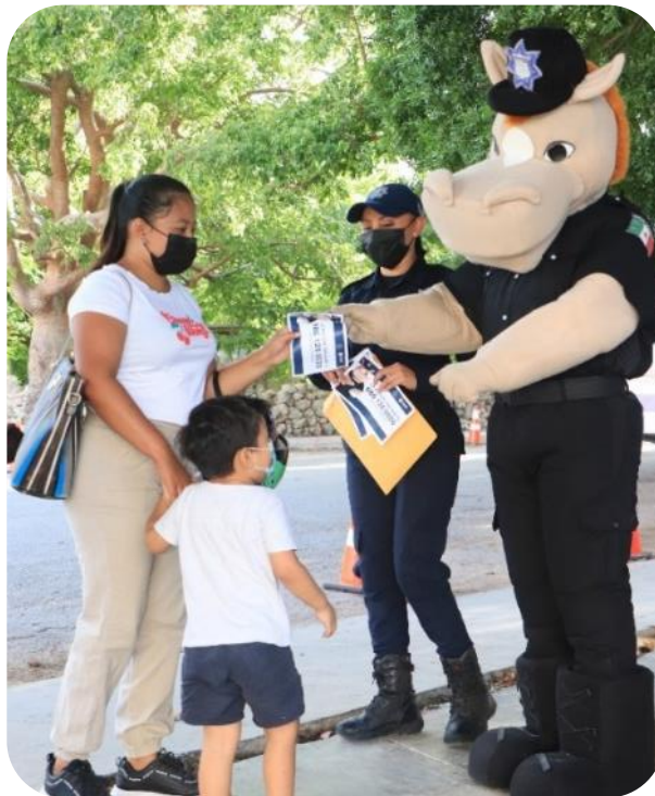
Programa “El policía es tu amigo” y la mascota Palomino realizando acciones de prevención.

Estas pláticas fueron impartidas a estudiantes, padres de familia, personal administrativo y directivos de escuelas, comisarios municipales, empleados de empresas, comerciantes, entre otros. Es importante destacar que recientemente se incorporó a estas pláticas el departamento de psicología de la policía. A través de estas pláticas, se ha logrado beneficiar a más de 1,703 personas.