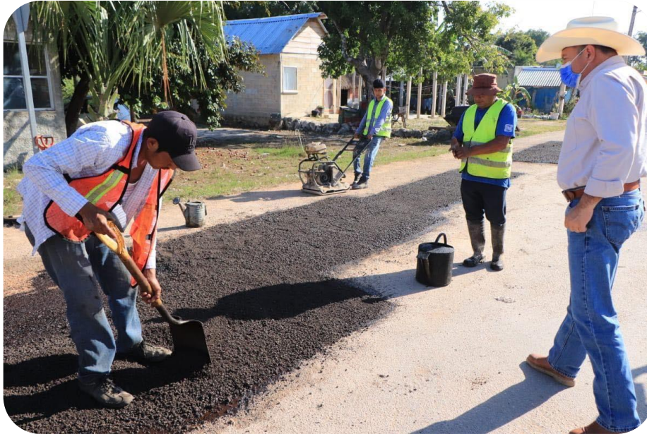
Supervisión de los trabajos del Programa Permanente de Bacheo.