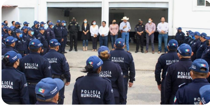
Entrega de uniformes nuevos a todos los elementos de la policía municipal.