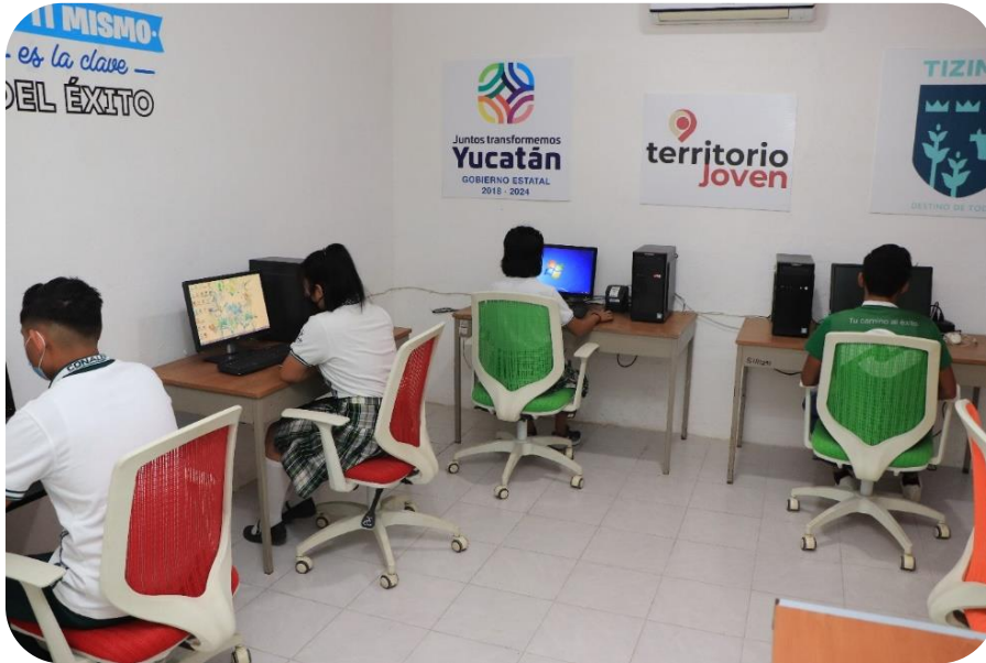
Instalaciones del Instituto Mexicano de la Juventud (IMJUVE Tizimín).

Respecto a la cultura, los integrantes del IMJUVE, realizaron una demostración de altares del “Hanal Pixan” y el “Paseo de las Ánimas”, siendo estas unas de las tradiciones más importantes del municipio.