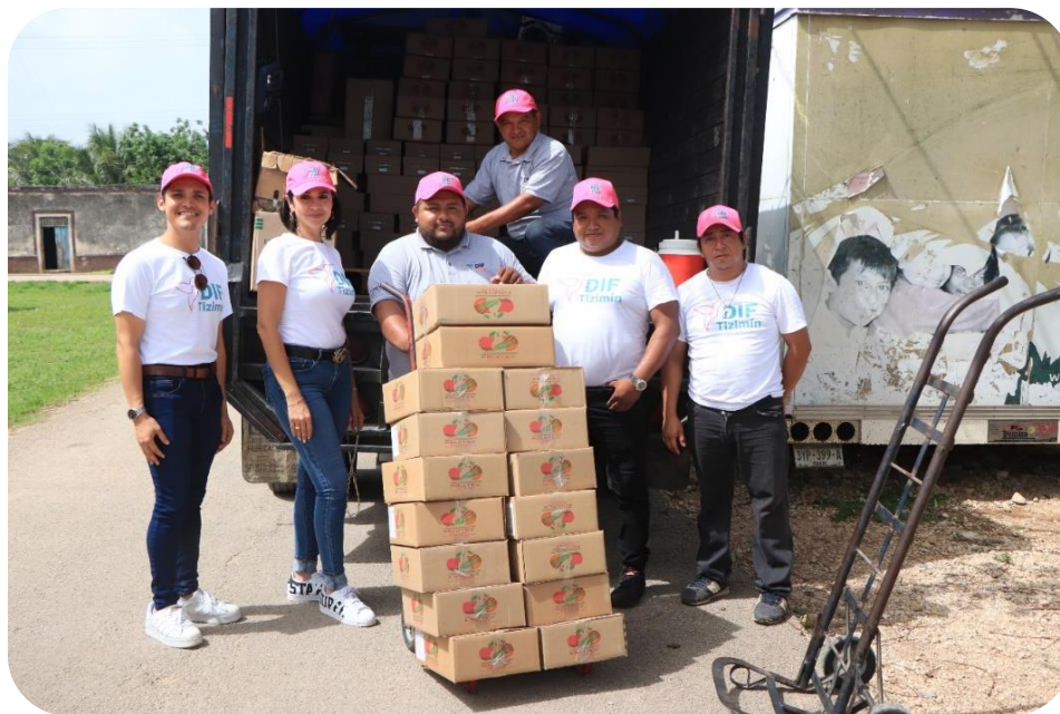
Entrega de insumos del Programa Desayunos Escolares.