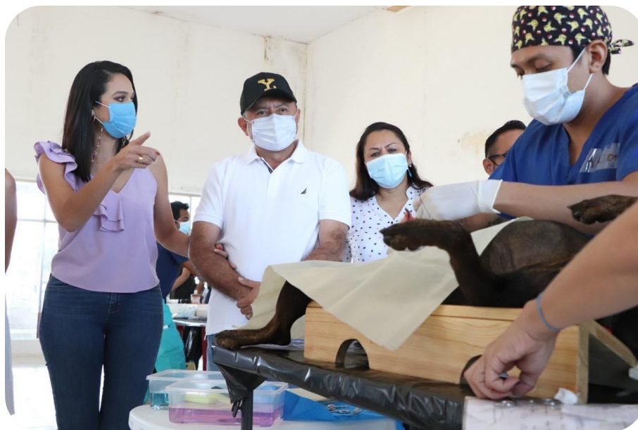
Primera jornada masiva de esterilización para perros y gatos.

Por otro lado, en observancia a los indicadores estipulados de salud; deporte; arte y cultura, que son clave para el buen desempeño del sector joven, los integrantes del Instituto Mexicano de la Juventud (IMJUVE Tizimín), han apoyado en la logística de las jornadas de salud y de vacunación realizadas por el Ayuntamiento; así mismo, han implementado jornadas en las que han expuesto los diferentes métodos anticonceptivos y de planeación familiar a las personas que han asistido. Actualmente, en dicho Instituto se encuentran involucrados más de 70 jóvenes activos en un rango de edad que va de los 15 a los 19 años.