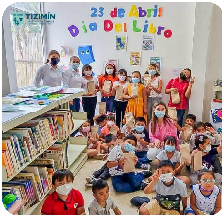
Niñas y niños asistentes en la celebración del día del libro en la Biblioteca Modelo "Juan Rivero Gutiérrez".

Algunas de las escuelas que han contado con el apoyo del Ayuntamiento son las siguientes: en cuanto a preescolares; la Ignacio Allende, Tsimin-Kah, Cristóbal Colón, Otilia López, Remigio Aguilar Sosa, Juan de la Barrera, Juan Rivero Gutiérrez, respecto a Primarias, la Justo Sierra, David Vivas Romero, Otilia López, Manuel Alcalá y Alcalá, Benito Juárez Indigenista, Abelardo Conde Ruz, Manuel Alcalá Martín, Gabino Barreda, Sebastián Molas, Adolfo López Mateos; en lo relativo a las Secundarias; Miguel Barrera Palmero y Jacinto Canek, así como la telesecundaria: Rosa María Ruz Rejón y las preparatorias, Colegio de Bachilleres del Estado de Yucatán (COBAY), plantel Tizimín, Yucatán y Colegio Nacional de Educación Profesional Técnica (CONALEP), plantel Tizimín, Yucatán.