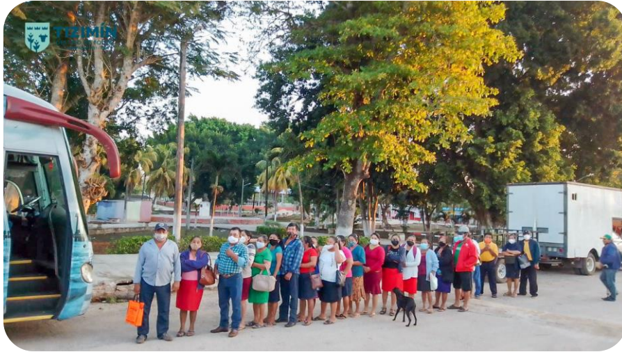
Apoyo de traslado de comisarías a la cabecera municipal para la aplicación de la vacuna Covid-19.