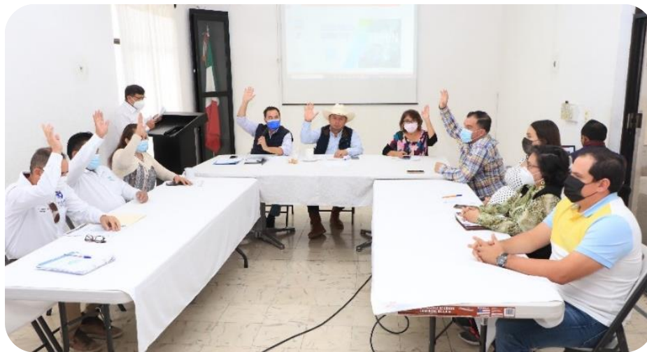
Sesión de cabildo para presentar la cuenta pública por parte del tesorero municipal.

A efecto de dar cumplimiento a lo establecido en la Constitución y la Ley de Transparencia y Ley de Competencia, el Instituto Estatal ha impartido cursos en materia de transparencia y acceso a la información en los que participó el personal de la unidad de transparencia Municipal.