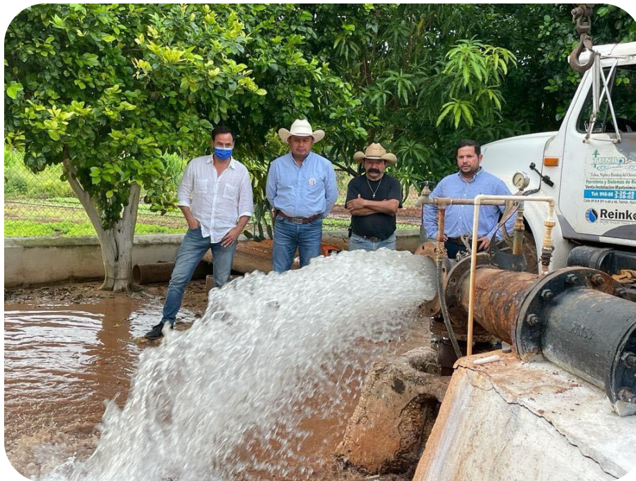
Renovación del equipo de bombeo de la planta de agua potable ubicada en la calle 47.

garrochas y registros de drenaje. Lo anterior con el fin de ofrecer un buen servicio de matanza, con las medidas de higiene normativas que establece los Servicios de Salubridad de Yucatán (SSA de Yucatán). Se pretende seguir trabajando con máximo esfuerzo para garantizar un buen servicio a la población de Tizimín, así como calidad en los productos que se consumen día a día, ya que en este periodo se sacrificaron a 13,479 cerdos y 582 bovinos.