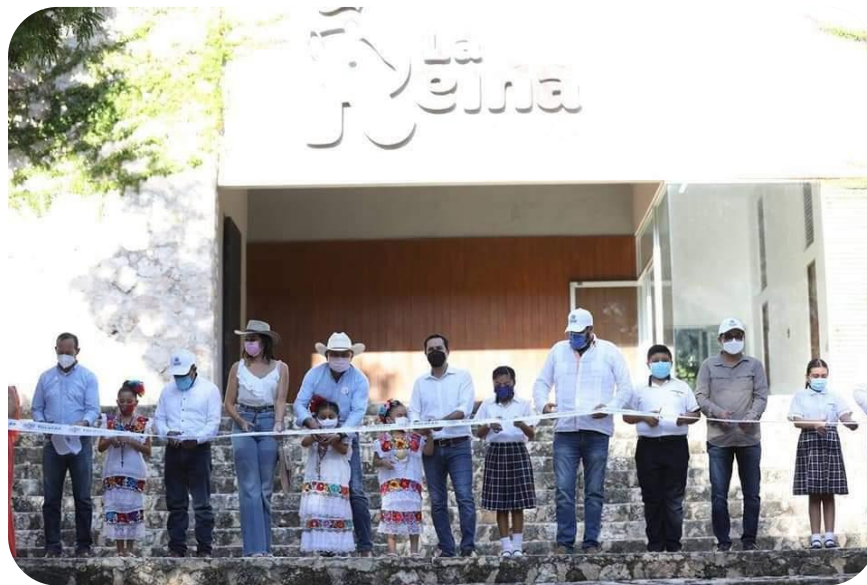
Corte de listón de la reinauguración del Parque Zoológico y Botánico "La Reina".