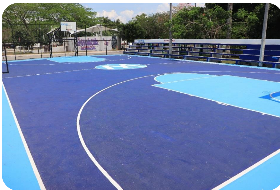
Cancha de básquetbol de la Libre Empresa mejorada con el Programa Adopta un Campo.