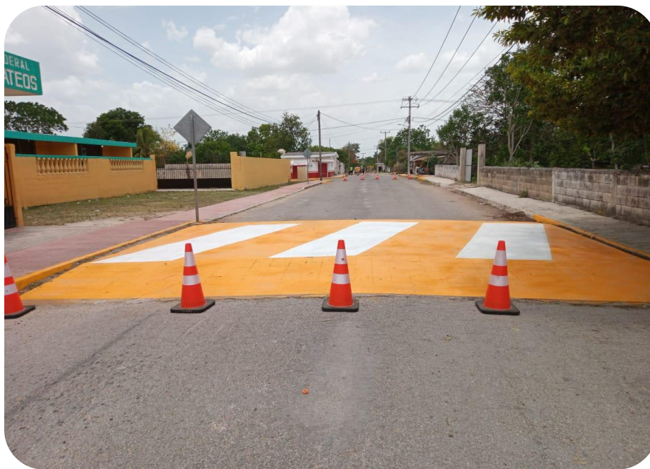
Pintura de franjas amarillas, blancas, pasos peatonales en las principales calles de la ciudad.

Derivado de que se han registrado de manera recurrente diversos hechos de tránsito en lugares específicos, tanto en la cabecera municipal, como en las comisarías; se instalaron diversos topes en la ciudad y comisarías; así mismo y a solicitud de las autoridades auxiliares de las comisarías, se ha gestionado la instalación de topes, a fin de beneficiar a todas las familias de las localidades y de esta ciudad.