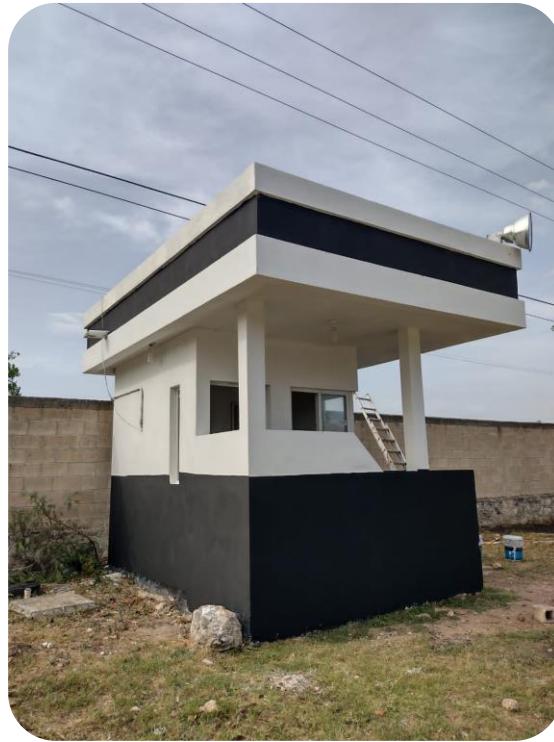
Mantenimiento de los puestos de control en los principales accesos de Tizimín.

Es de nuestro interés generar un cambio positivo en la percepción de la ciudadanía hacia la Seguridad Pública, promoviendo un modelo participativo entre gobierno y sociedad, para fortalecer la cultura de prevención, se creó el programa “El policía es tu amigo”, el cual está basado en pláticas impartidas por el departamento de prevención social de la violencia y la delincuencia, el área de peritos de tránsito y la mascota de la policía municipal “Palomino”; tratando de disminuir con estas acciones el índice delictivo y los hechos de tránsito, mediante la impartición de los siguientes temas: