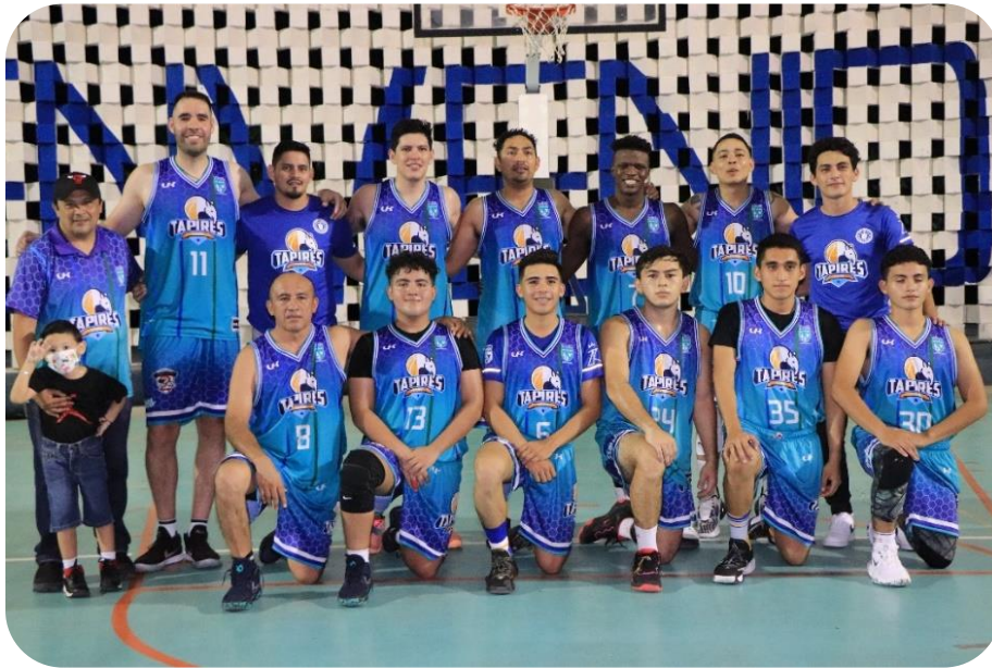
Integrantes del equipo de básquetbol municipal “Tapires” de Tizimín que participan en el CYBA.

Respecto a la infraestructura deportiva que recibió el actual Ayuntamiento, esta se encontraba en pésimas condiciones y en total abandono, tampoco se contaba con material deportivo, el departamento de deportes realizó un censo de las canchas y campos, cuyo resultado arrojó que en Tizimín se cuenta con 28 lugares de esparcimiento, de los cuales 23 son canchas públicas y 5 privadas.