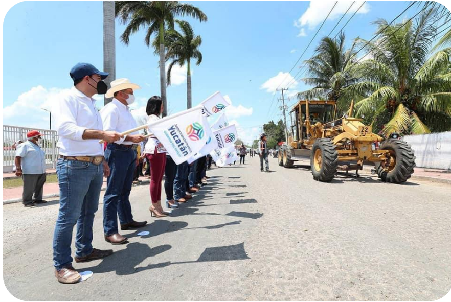
Banderazo de inicio de los trabajos de repavimentación de la calle 48 de la calle 51 hasta la calle 81.