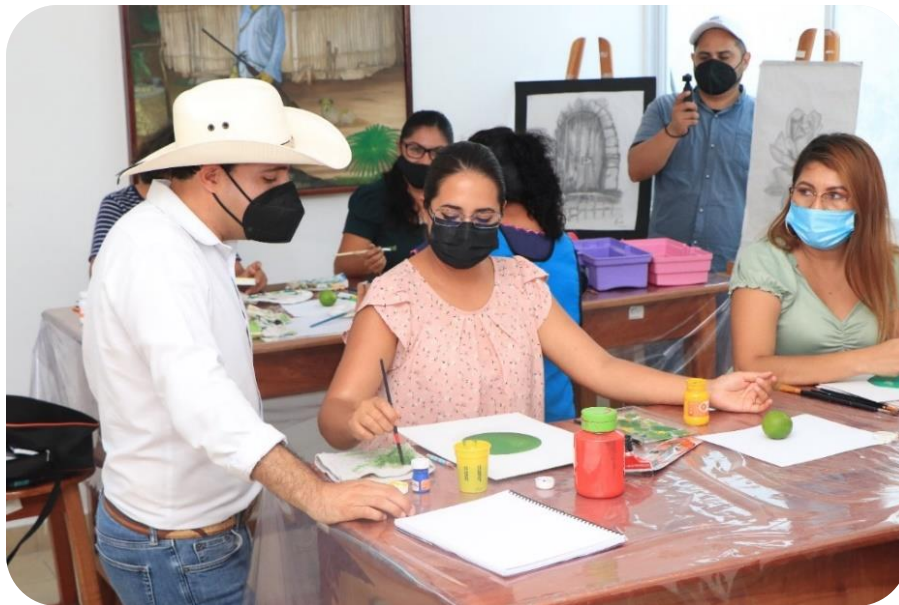
Visita del gobernador del estado de Yucatán el Lic. Mauricio Vila Dosal a los talleres gratuitos de la Casa de la Cultura

ciudadanos, se ha estado adecuando la matrícula de los talleres con mayor demanda, teniendo como resultado el incremento de los alumnos que toman los talleres y agregándose otros, como el nuevo taller de “Rescate de la Lengua Materna – Maya”. Cabe precisar que al inicio de la administración se contaba con un total de 189 usuarios y en la actualidad se cuenta con 348 alumnos en la cabecera municipal y 105 en las comisarías, logrando tener un total de 453 alumnos.