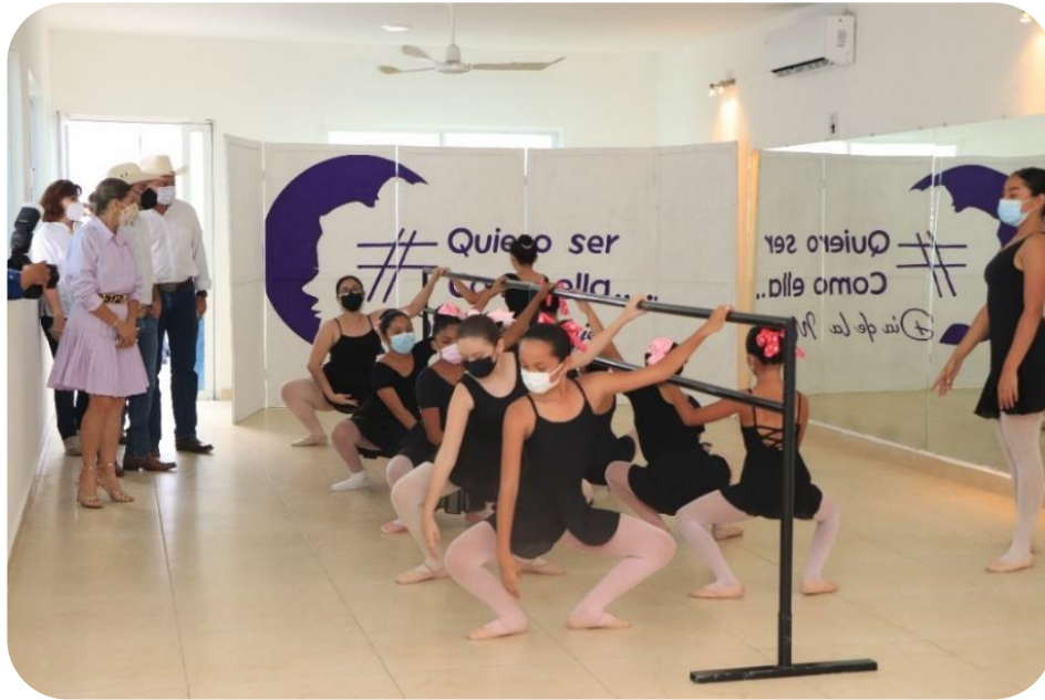
Vista del gobernador del estado el Lic. Mauricio Vila Dosal al taller de danza de la Casa de la Cultura.