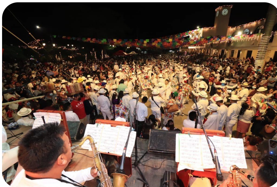
Vaquería de la Tradicional FERIA DE REYES TIZIMÍN 2022.

De igual manera se ha trabajado en coordinación con la Secretaría de Cultura y las Artes (SEDECULTA), del Gobierno del Estado de Yucatán, presentando diversas exposiciones en nuestra ciudad y en las comisarías, en las que se busca transmitir y rescatar nuestra herencia cultural, pudiendo mencionar a manera de ejemplo, el cinema gigante que llegó a las comisarías, en las que se transmitieron cortometrajes culturales yucatecos; además, se abrió un taller de agentes culturales en la Casa de la Cultura, en donde se atendió a los emprendedores locales que a través de la herencia artesanal de la familia, trabajan con elementos de la naturaleza; a raíz de eso, un proyecto tizimileño fue elegido y enviado a la Organización de las Naciones Unidas para la Educación, la Ciencia y la Cultura (UNESCO), representando a nuestra ciudad.