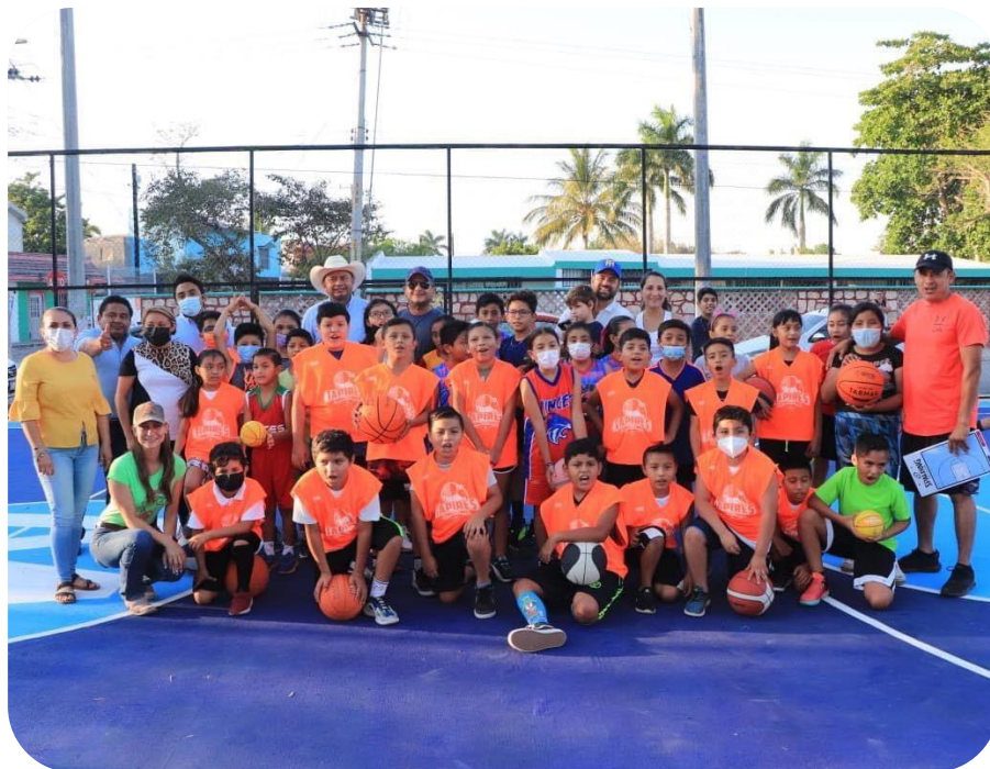
Inauguración de la cancha de básquetbol de la Libre Empresa adoptada por la empresa “Witzi La Placita”.

se han rehabilitado el 55% de las canchas y campos existentes, beneficiando a más de 3,000 personas entre deportistas, aficionados y público en general.