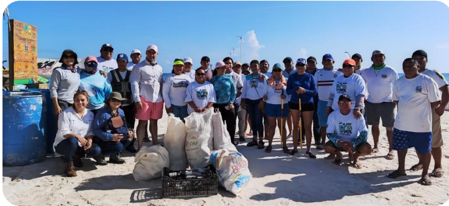
Recolecta de residuos sólidos en el puerto de el Cuyo.