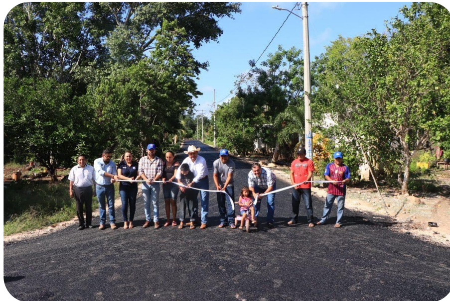
Corte de listón de la nueva calle pavimentada de la comisaría de Chenkekén.