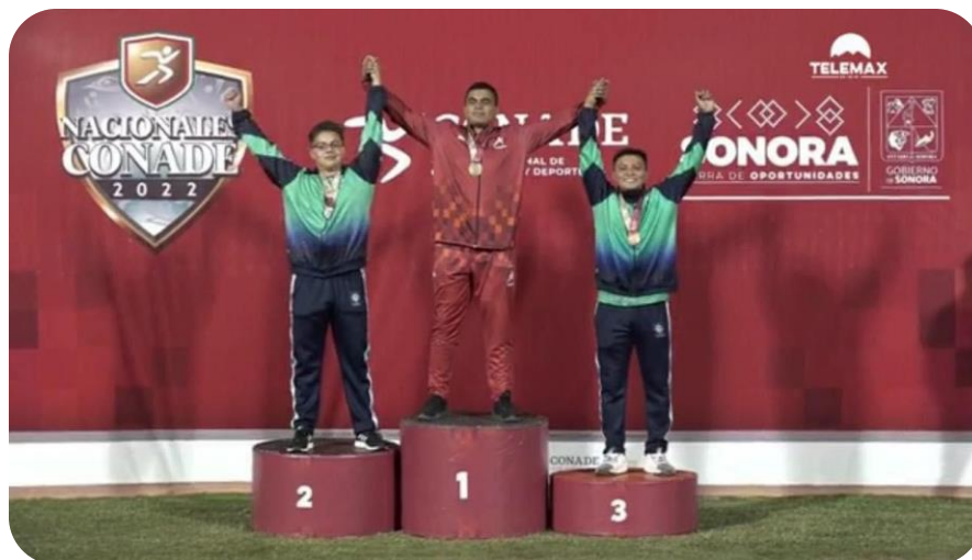
Medallistas de atletismo en las competencias nacionales CONADE 2022.