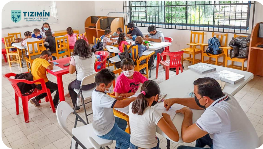
Programa de regularización y asesorías en los niveles preescolar, primaria y secundaria.