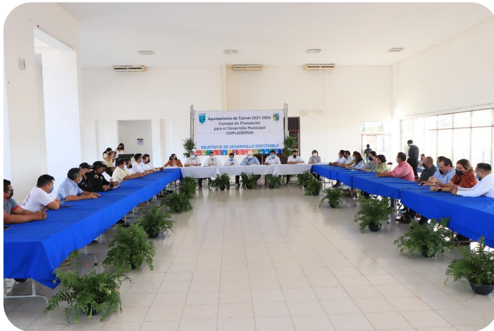
Sesión Ordinaria del Consejo de Planeación del Desarrollo Municipal (COPLADEMUN).

un futuro Seguro y en paz; así como los ejes transversales de: Participación Ciudadana; Transparencia y Rendición de Cuentas; Gobierno Abierto, Eficiente y con Finanzas Sanas; Tecnología e Innovación y Equidad, justicia e igualdad; el cual fue aprobado por unanimidad de votos del Cabildo, en la Decimoprimer Sesión Extraordinaria.