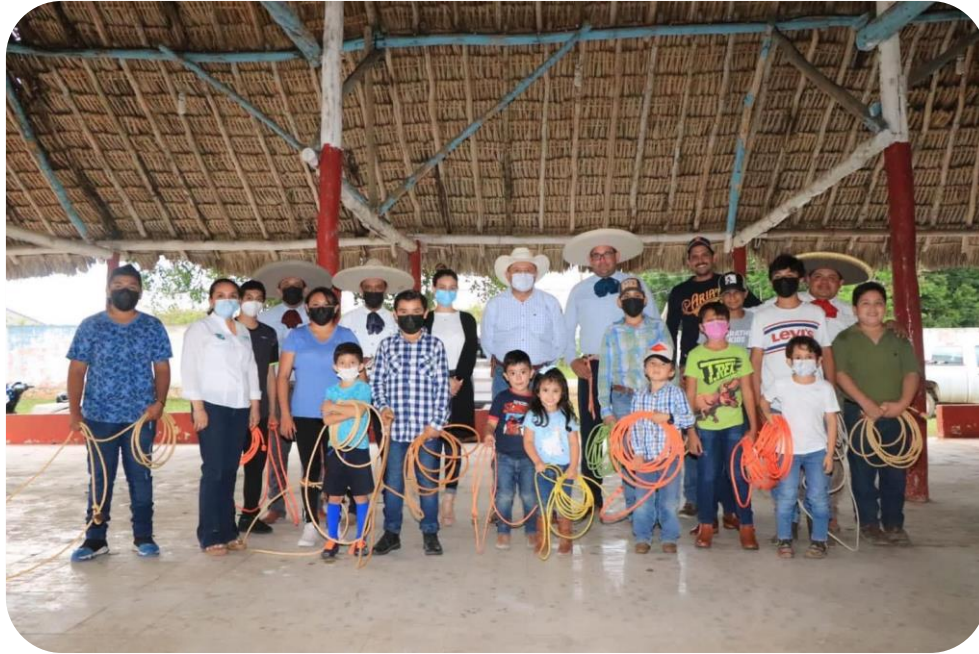
Inauguración de la escuela municipal de charrería, única en el estado de Yucatán.

Con el objetivo de aumentar la activación física de la población, se desarrollaron programas deportivos y actividades recreativas para la prevención de adicciones y otras conductas de riesgo entre niñas, niños y adolescentes; se han realizado 42 torneos y ligas municipales en las siguientes disciplinas: fútbol, basquetbol, softbol, béisbol, box, atletismo y levantamiento de pesas, en diferentes categorías: infantil, juvenil, femenil y mixta, beneficiando más de 2,000 deportistas.