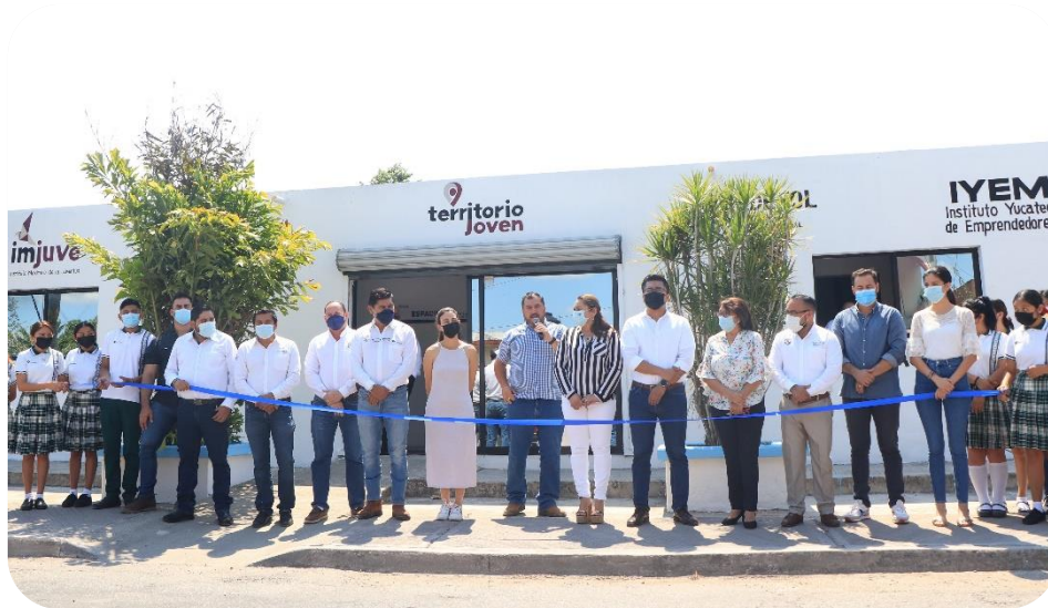
Corte de listón de las oficinas Territorio Joven del Instituto Mexicano de la Juventud (IMJUVE Tizimín).