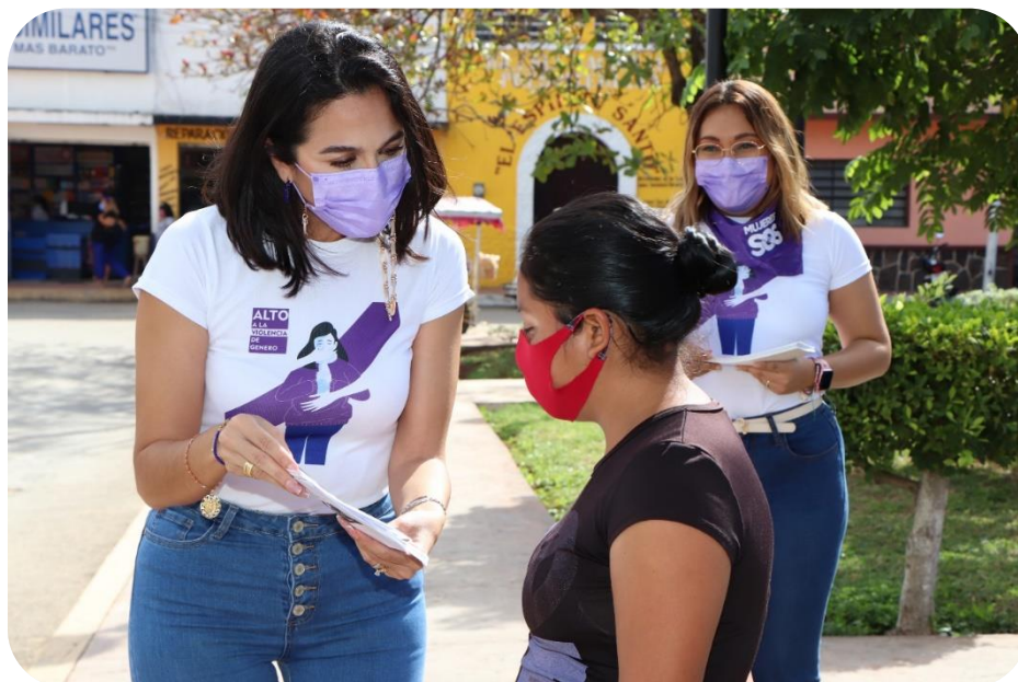
Volanteo violeta en coordinación con El Instituto Municipal de la Mujer y el Sistema Municipal para el Desarrollo Integral de la Familia (DIF Tizimín).

De igual manera, con la finalidad de mejorar los servicios e infraestructura del Centro Comunitario, para contribuir a elevar la calidad de vida de la población, se realizaron programas tendientes a contribuir con la mejora en el desarrollo de las habilidades de las personas con capacidades diferentes, quienes se encuentran en una desventaja social por su especial condición.