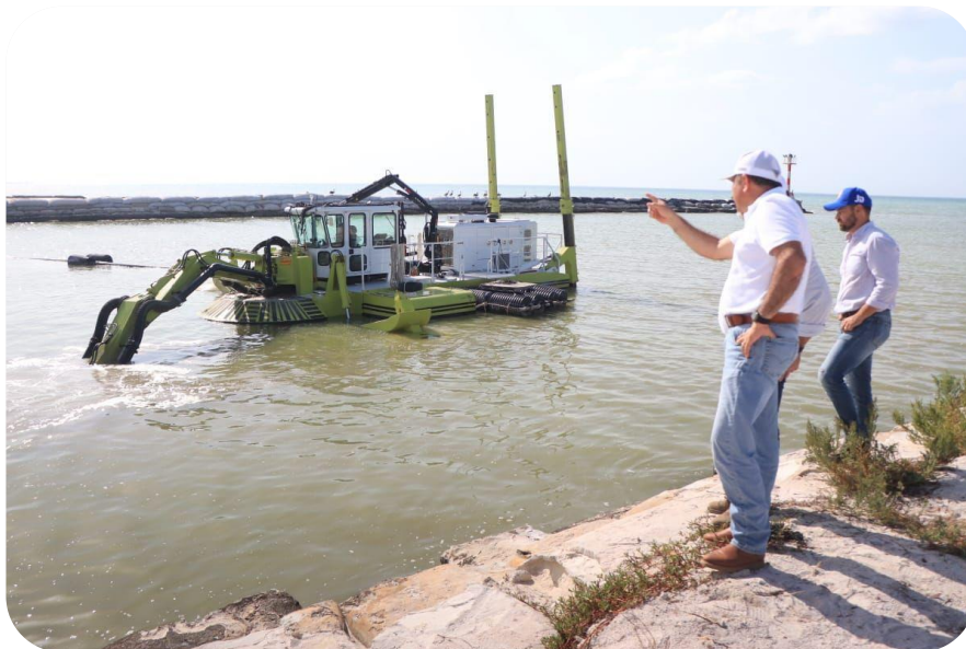
Supervisión de los trabajos de dragado del puerto de abrigo en la comisaría del Cuyo.