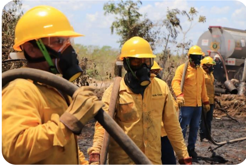
Brigada contra incendios "Tapires".

Para fortalecer este programa municipal, se firmó un convenio con la Comisión Federal de Electricidad (CFE), sumando esfuerzos con el gobierno federal para lograr la conectividad total en el municipio.