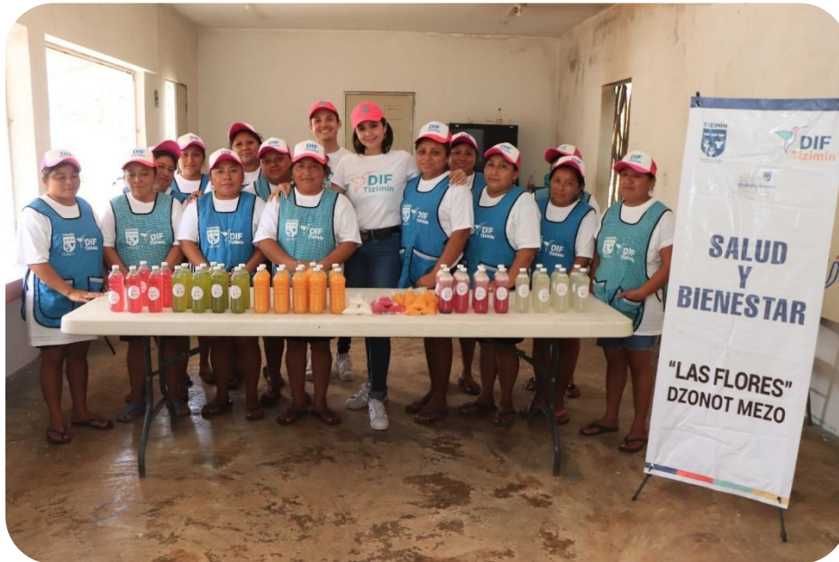
Talleres de elaboración de jugos del programa Salud y Bienestar en la comisaría de Dzonot Mezo.