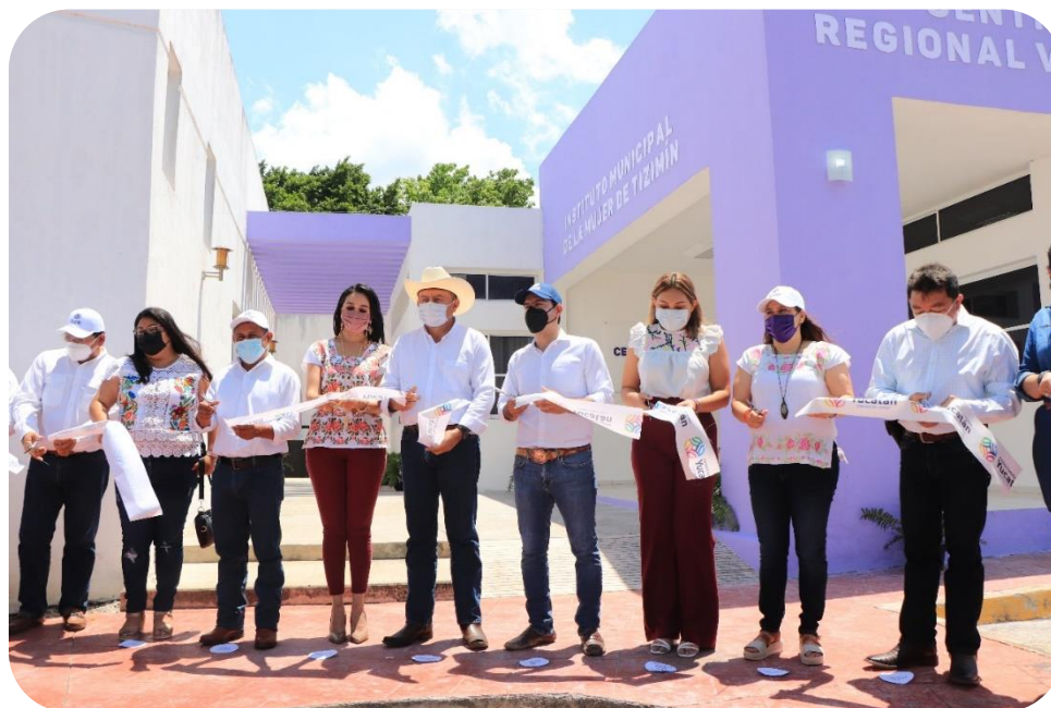
Inauguración de las instalaciones del Instituto Municipal de la Mujer por parte del Gobernador del Estado el Lic. Mauricio Vila Dosal.