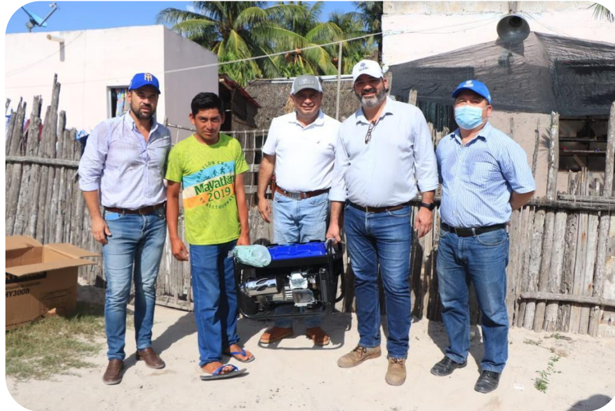
Entrega de equipamiento del programa Peso a Peso Pesquero.

diferentes gestiones del Gobernador del Estado, Lic. Mauricio Vila Dosal, se consiguió la maquinaria moderna para continuar con el dragado, la cual se encuentra trabajando en el puerto de abrigo de la comisaría del Cuyo. Cabe hacer mención que esté trabajando que se está concretando es una demanda histórica de los pescadores del Puerto del Cuyo.