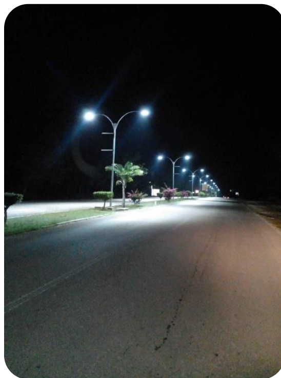
Sustitución de las luminarias de la Avenida U Bel Il Lakin.