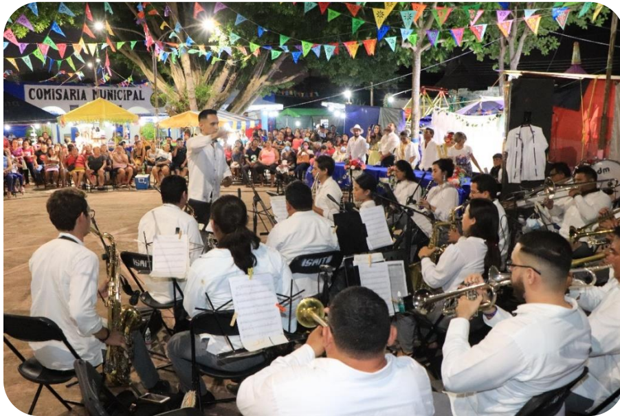
Presentación de la banda de música del Ayuntamiento de Tizimín en la fiesta patronal de la comisaría de Tixcanal.