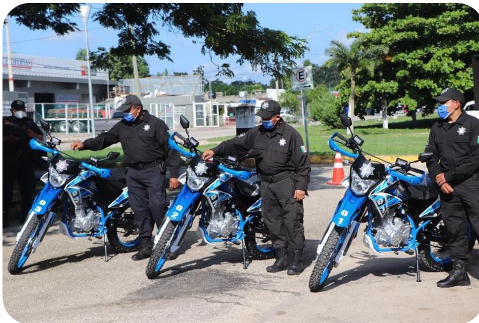
Entrega de 3 moto patrullas a la policía municipal.