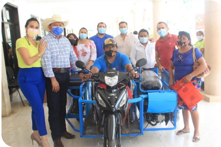
Entrega de motocicleta adaptada en la jornada de aparatos funcionales del Sistema Estatal para el Desarrollo Integral de la Familia (DIF Yucatán) y la Fundación TELMEX.