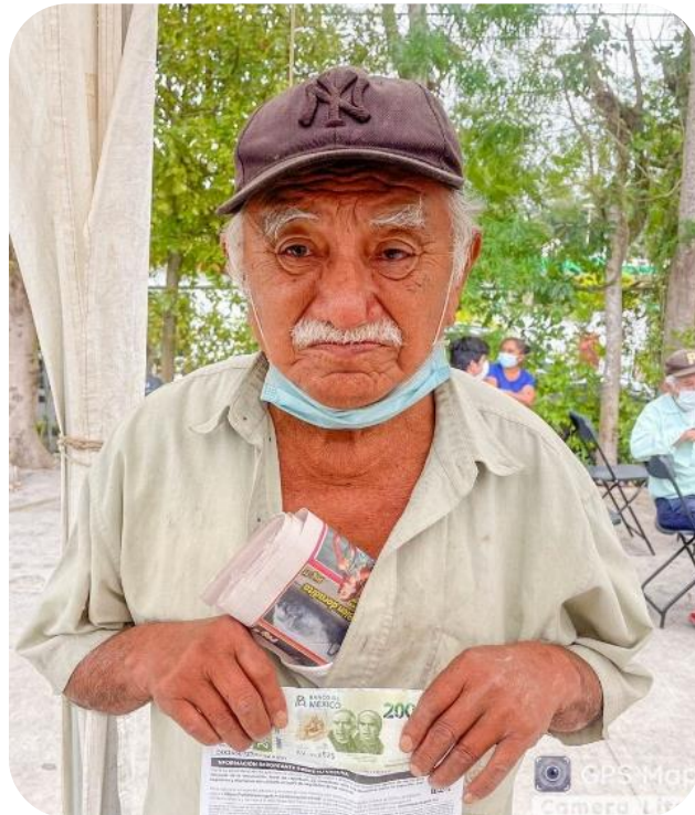
Entrega de incentivo económico para la aplicación de la primera dosis de la vacuna COVID-19.