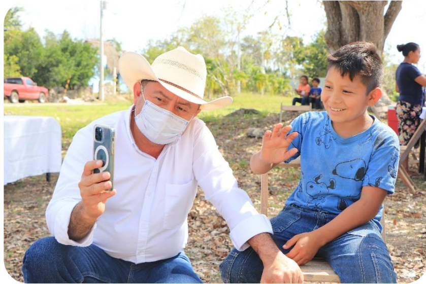
El presidente municipal C. Pedro Francisco Couoh Suaste realizando una videollamada en la comisaría de El Limonar a través del programa Internet Gratuito.