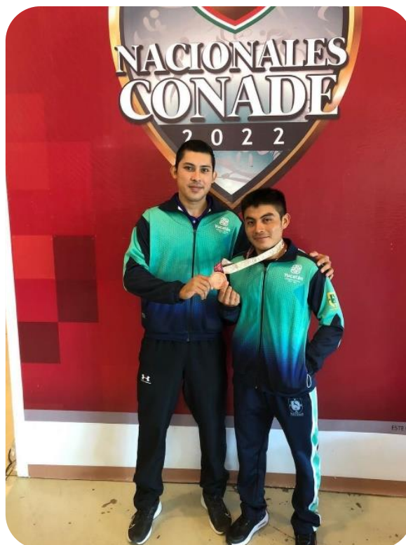
Medallista de levantamiento de pesas en competencias nacionales CONADE 2022.

Como una muestra más de apoyo al talento deportivo de las y los tizimileños en el que se busca que cuenten con las condiciones necesarias para el desarrollo de todo su potencial, se firmó un convenio con el Instituto del Deporte del Estado de Yucatán (IDEY), en el que se consideró un monto de $140,000.00 M.N. (ciento cuarenta mil pesos, moneda nacional), para apoyar a los deportistas de alto rendimiento.