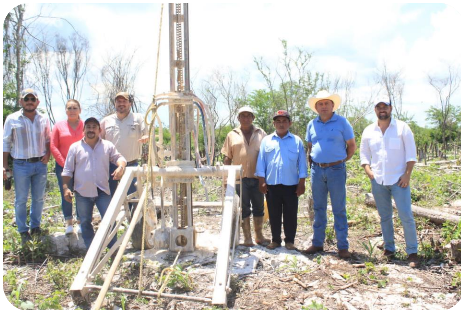
Supervisión de Pozos Profundos en la comisaría de Chan Cenote

En una muestra más de la coordinación existente entre este Ayuntamiento y el Gobierno del Estado; con el apoyo de la Secretaría de Desarrollo Rural (SEDER), el gobierno municipal puso en marcha el programa de “Seguridad Alimentaria” que tiene la finalidad de ayudar a la población con niveles de pobreza moderada o extrema, mediante la entrega de sacos de granos de maíz de 20 kg para el consumo de las familias en condición de vulnerabilidad, tanto de la cabecera municipal, como de las comisarías, auxiliando de esa manera las necesidades básicas de alimentación. Se precisa que mediante dicho programa, se entregaron 19,300 sacos de maíz de 20 kg a igual número de personas, con una inversión de $2, 624,800.00 (dos millones, seiscientos veinticuatro mil, ochocientos pesos, moneda nacional).