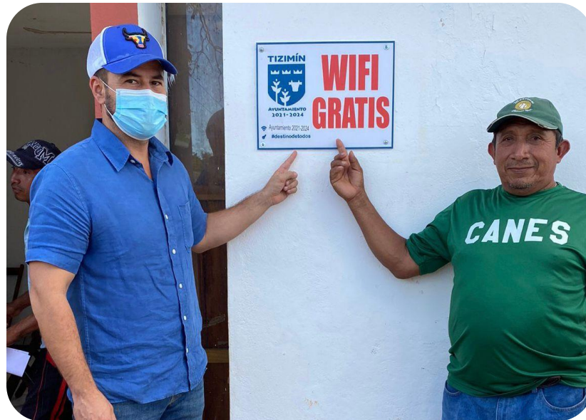
Instalación de puntos gratuitos de internet en las comisarías.