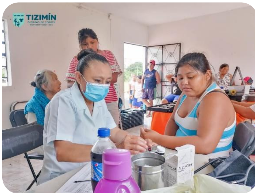
Aplicación de pruebas gratuitas en las Jornadas de la Salud del Municipio.

Con la finalidad de fortalecer la concertación con otras dependencias, se han atendido las peticiones instadas por el Hospital General San Carlos de esta ciudad, por lo que este Ayuntamiento apoya con personal de cocina de manera permanente, para la elaboración de alimentos y bebidas, destinadas al consumo de los derechohabientes y personal médico que labora en ese nosocomio.