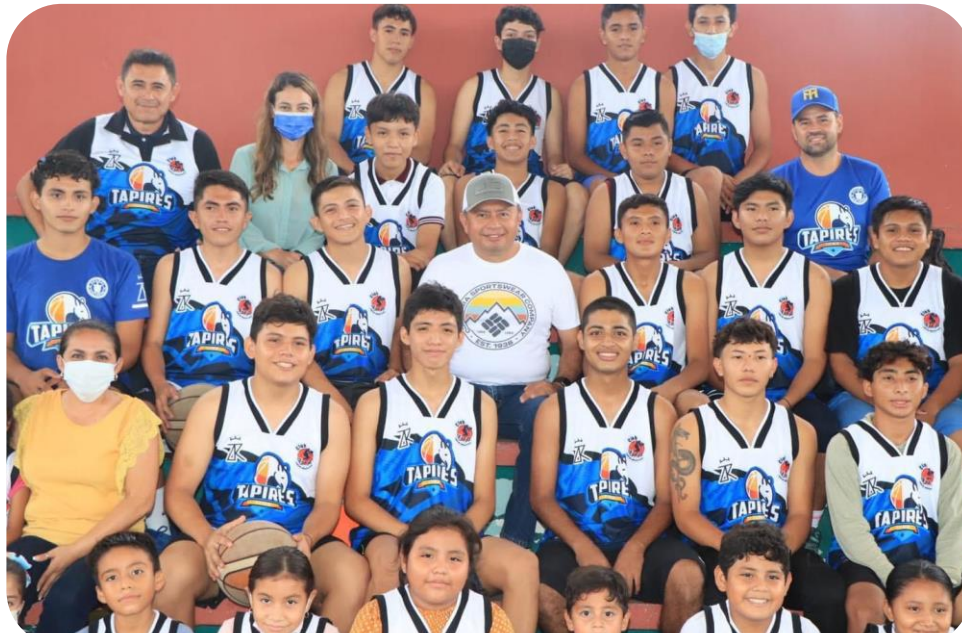
Entrega de uniformes a los integrantes de la escuela deportiva de básquetbol "Tapires".

Es de destacarse que los semilleros que son las escuelas deportivas municipales, hoy atienden a 624 niñas, niños y adolescentes, de modo que se trabaja en 13 disciplinas deportivas en diversas sedes: Polifuncional, FOVISSSTE, Centro Comunitario, La Valencia y se dio inicio en las comisarías del Cuyo y Colonia Yucatán.