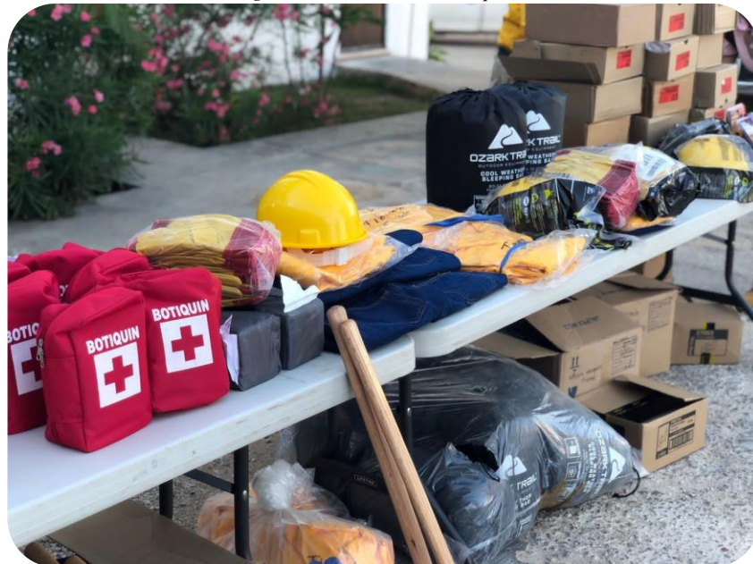
Equipo adquirido a través de la firma del convenio entre la CONAFOR y el Ayuntamiento de Tizimín.