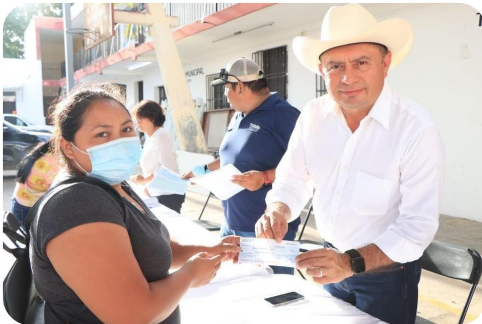
Entrega de microcréditos para emprendedores tizimileños.

Con el objetivo de posicionar la ciudad de Tizimín como centro regional de prestación de servicios al turismo nacional y extranjero en la zona, se participó en el tianguis turístico, donde se concretaron 43 citas por parte de la Dirección de Fomento Económico, es importante mencionar que este evento es el más relevante del sector turístico de México, donde expositores y compradores de varios estados de la república, tuvieron la oportunidad de ofertar sus productos artesanales, gastronómicos, así como sus servicios de turismo, como hoteles, aerolíneas, ferias, sedes, entre otros.