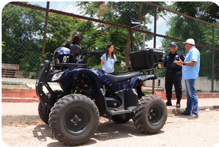
Entrega de 5 cuatrimotos como parte del equipo nuevo a la policía municipal.