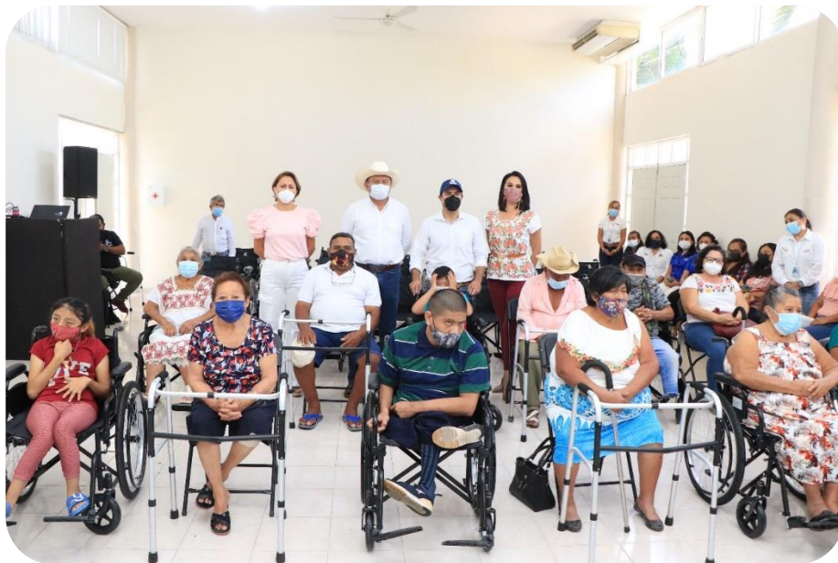
Entrega de sillas de ruedas, sillas para baños, bastones y andaderas por el Gobernador del Estado Lic. Mauricio Vila Dosal a diversos beneficiarios.

También se realizó en coordinación con el Gobierno del Estado que encabeza el Gobernador Mauricio Vila Dosal, la Caravana denominada “Yucatán por el Hambre Cero” apoyando a 1,000 personas.